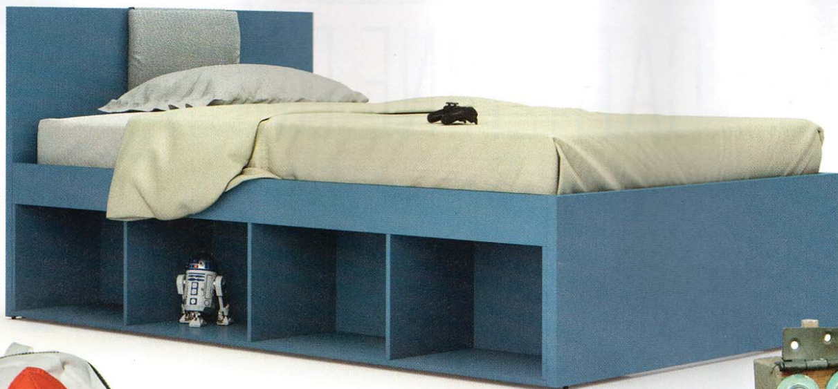
Il letto: con libreria, Nuk, Nidi, prezzo su richiesta.