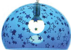
La lampada: Fl/y, Kartell, da 251 euro (small).