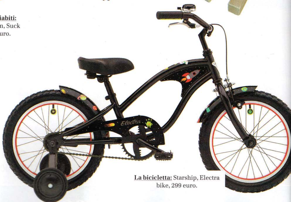
La bicicletta: Starship, Electra bike, 299 euro.