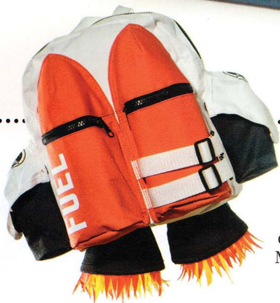
Lo zaino: Jetpack, Suck Uk, 42 euro.